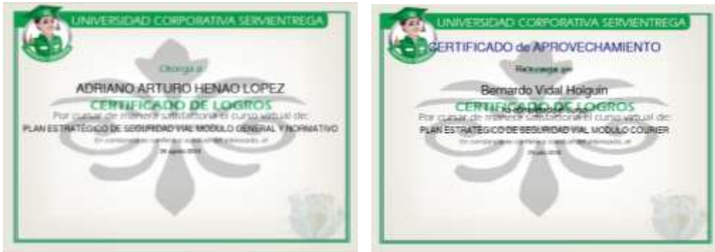
IMÁGENES DE UNIVERSIDAD COPORATIVA