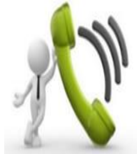
Línea de Atención al transportador 24/7