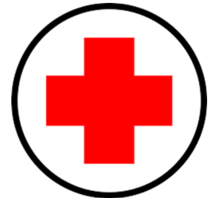
Jornadas de Salud