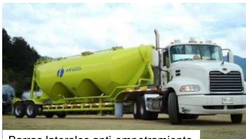
Barras laterales anti-empotramiento