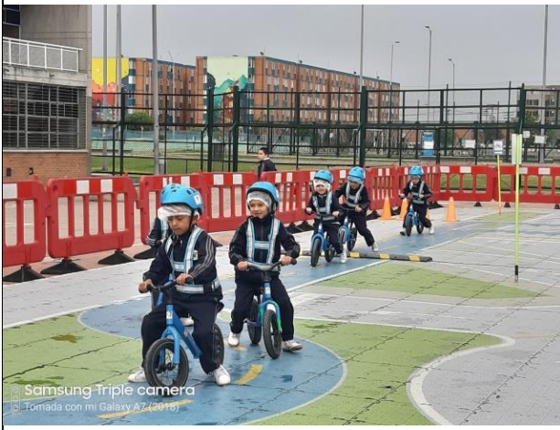
© Samsung Triple camera Tomada con mi Galaxy A7 (2018)