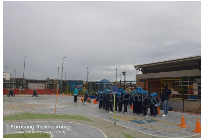
© Samsung Triple camera Tomada con mi Galaxy A7 (2018)