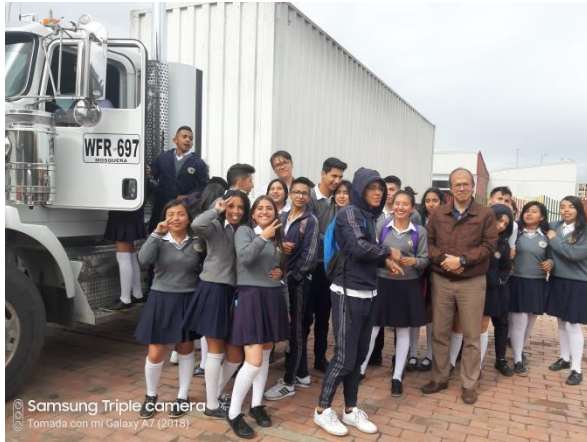
© Samsung Triple camera Tomada con mi Galaxy A7 (2018)