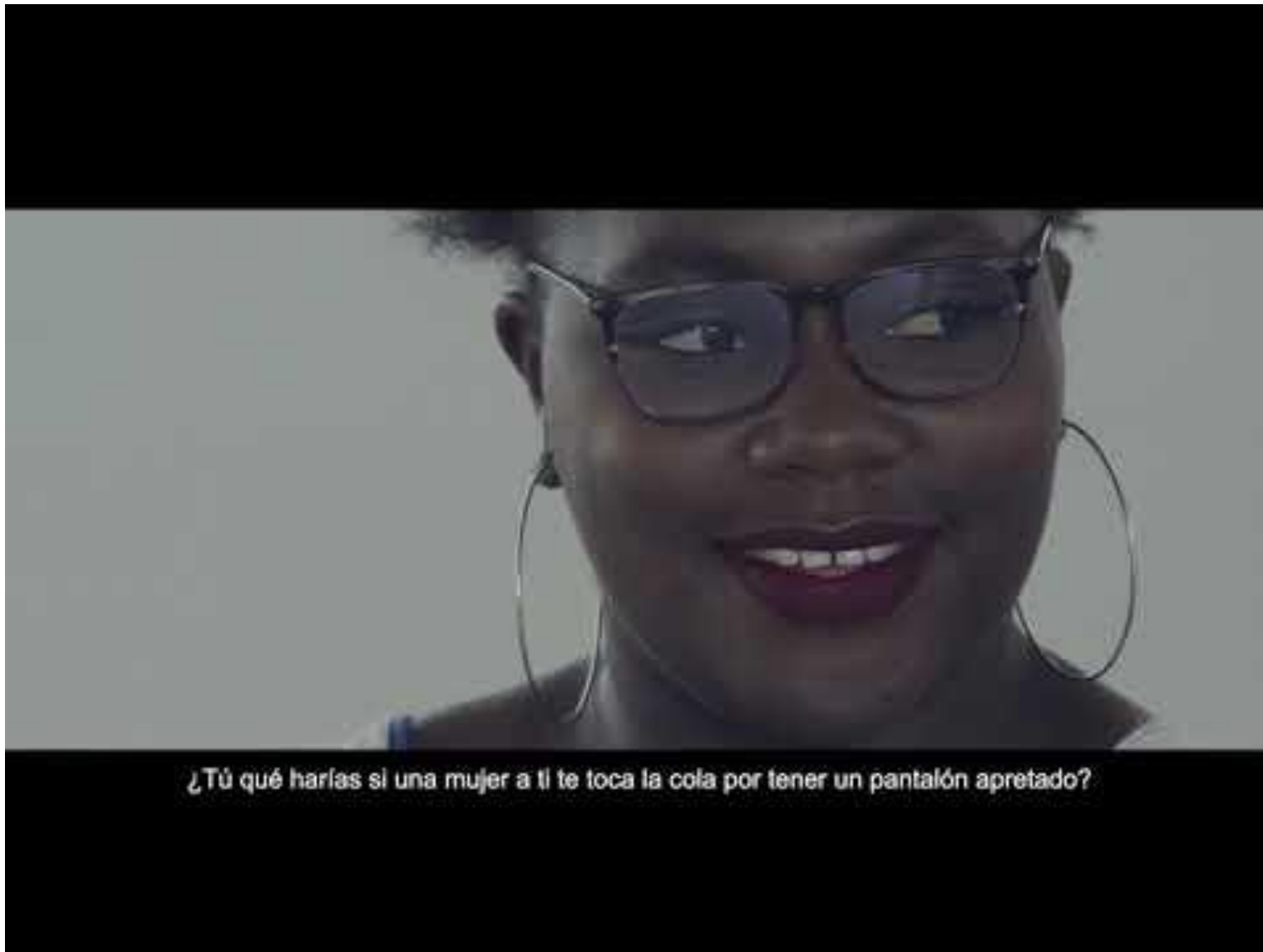
Video: #EsViolencia Experimento social..