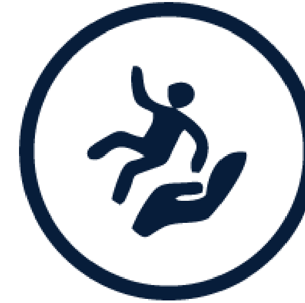
Atención a Víctimas