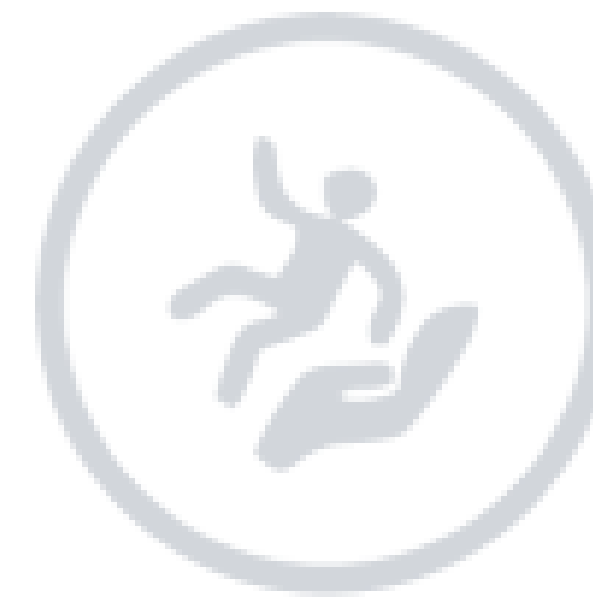
Atención a Víctimas