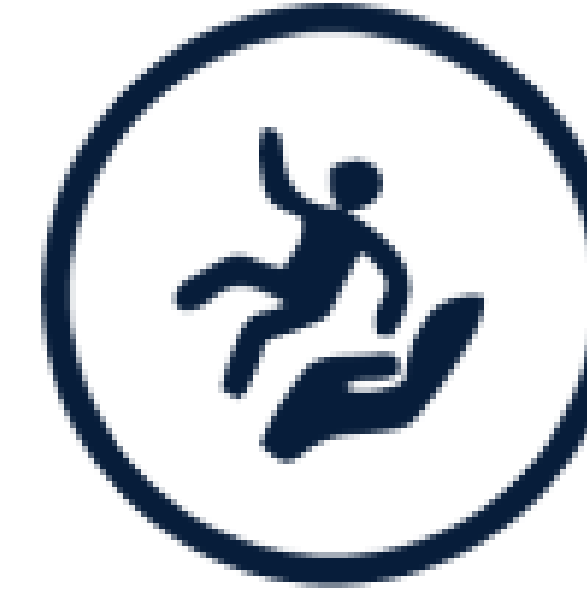
Atención a Víctimas